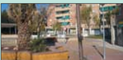
370.000 € Parcs i Jardins