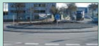
290.000 € Pla de mobilitat