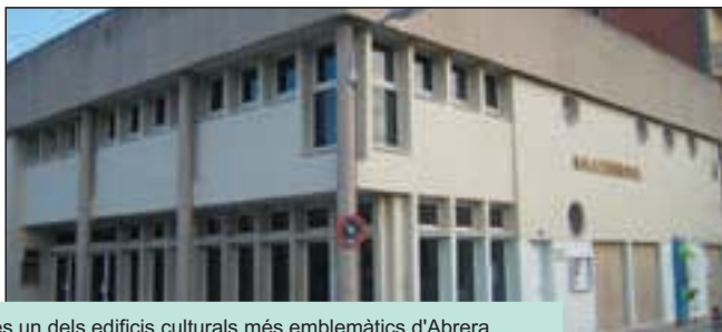
La Sala Municipal és un dels edificis culturals més emblemàtics d'Abrera