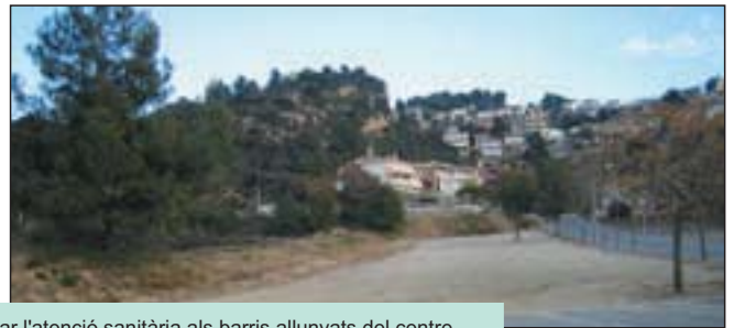
El 2006 serà clau per millorar l'atenció sanitària als barris allunyats del centre

L'objectiu del govern és transformar les urbanitzacions en barris: 180.000 € pel nou ambulatori de Can Vilalba i 120.000 per a l'ascensor del de Santa Maria.