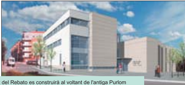
El Centre Polivalent del Rebató es construirà al voltant de l'antiga Purlom